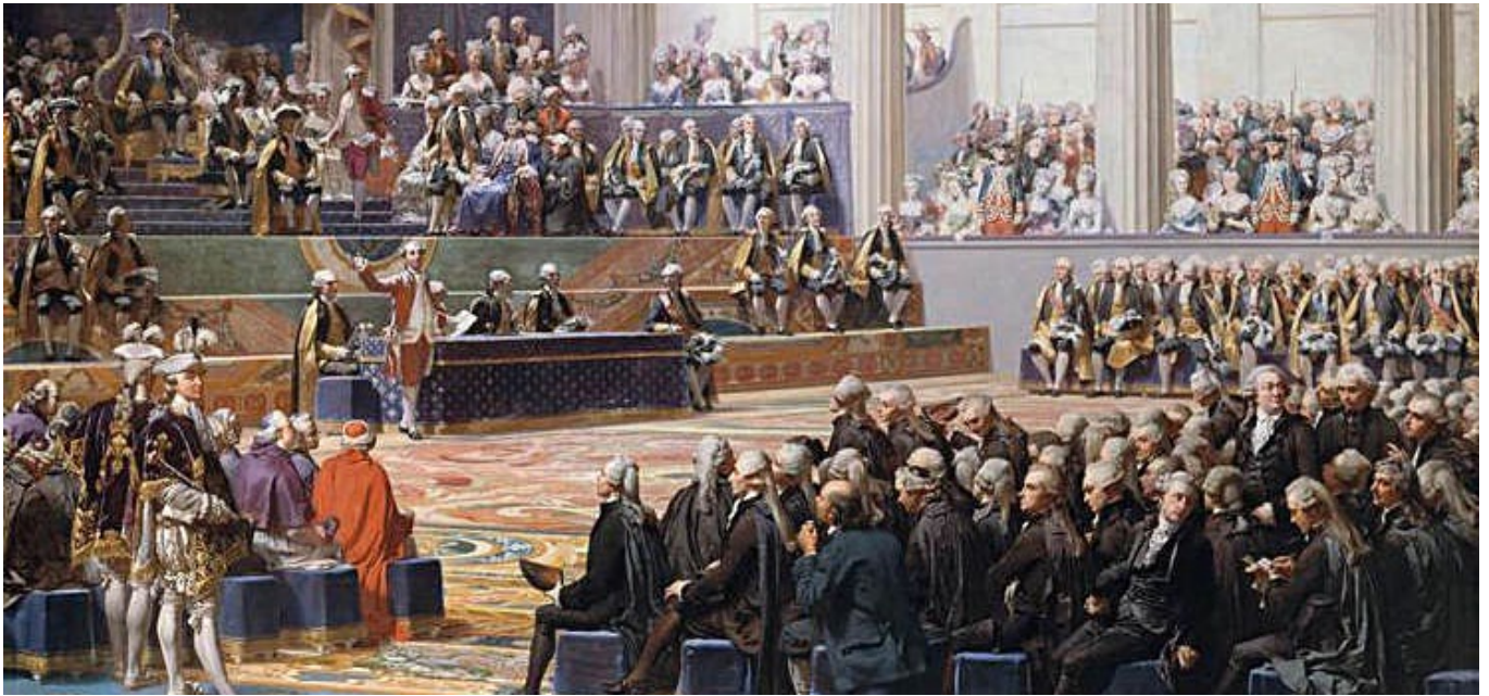
La inauguración de los Estado Generales en Versalles, en el año 1789.

La Revolución francesa comenzó con la rebelión de los representantes del pueblo llano en los Estados Generales en mayo-junio de 1789. El proceso que se desató a partir de entonces supuso una conmoción de tal envergadura en el sistema social francés, que modificó para siempre las estructuras socioeconómicas del país.